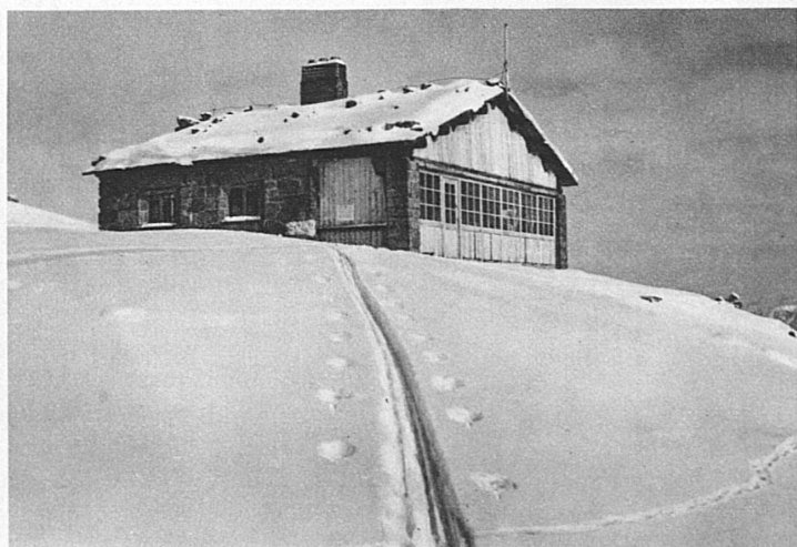
Cabane de Corviglia sur St-Moritz – Corvigliahütte bei St. Moritz