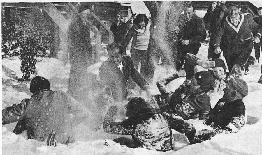
Escarmouche à l'arme blanche — Schneeballschlacht