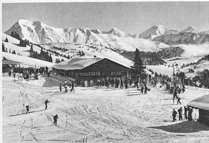
Au Hornberg (Montreux-Oberland bernois) – Hornberg ob Saanenmöser

nique de la construction en montagne, et à l'initiative des clubs locaux et des sociétés de développement, ont abouti à l'édification de ces magnifiques cabanes modernes qui, pour le confort, n'ont rien à envier à nos maisons d'habitation. Certaines sont de vrais petits hôtels, où des tenanciers affables tiennent auberge pour les voyageurs les plus exigeants. On en trouve jusqu'à trois mille mètres; telle la Diavolezzahütte que le skieur atteint en moins de trois heures, et d'où il gagnera la station de Morteratsch après une incomparable course de glacier. Moins ambitieux, il trouvera à 2500 m la Bovalhütte, cabane du C. A. S. au-dessus du glacier de Morteratsch, d'où il rejoindra la piste de descente de la Diavolezza au pied de la fameuse Isla Persa. Comme type de cabane récent, on peut mentionner la cabane de Moiry, au fond du val de Moiry près du Grand Cornier, et celle du Trient. Celles-ci sont en pierre, et leur maçonnerie affecte