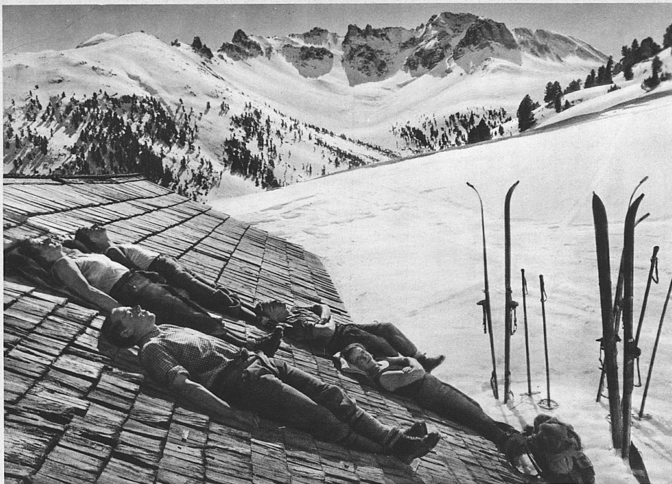
La sieste sur le toit (Basse-Engadine) – Siesta auf dem sonnigen Hüttendach