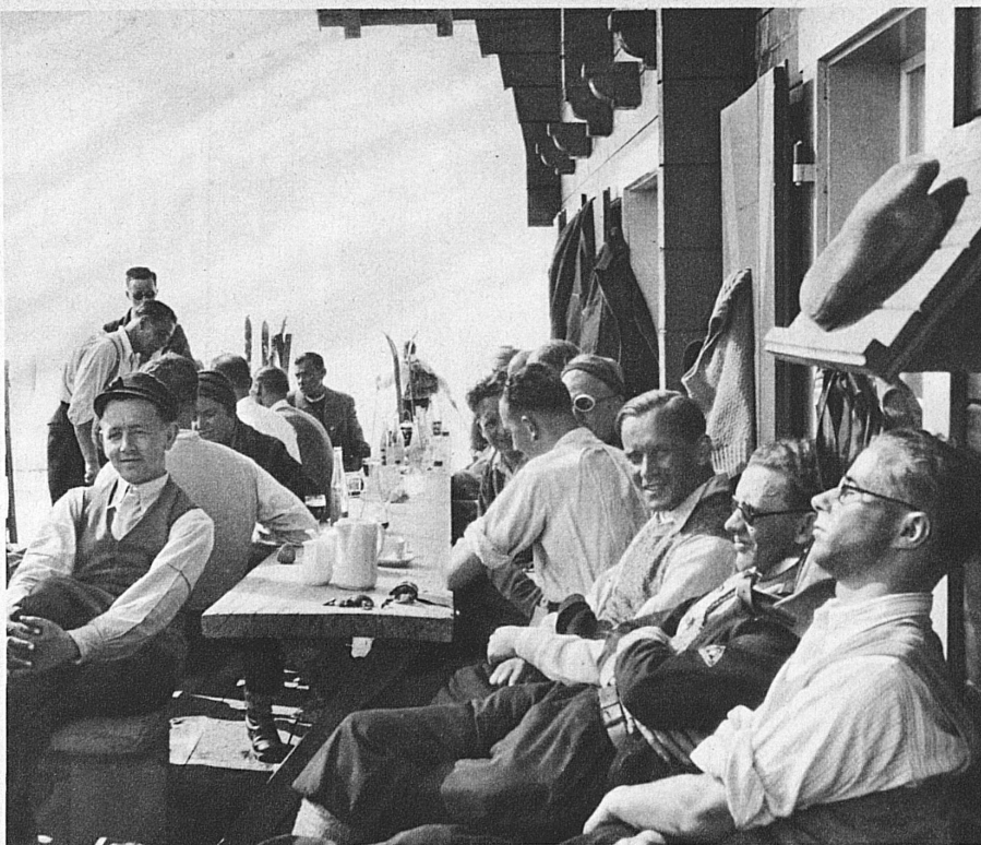
Des gaillards contents — Frohes Hüttenleben