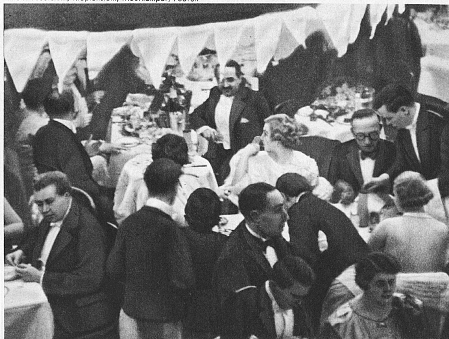
Soir à l'hôtel — Abend im Hotel