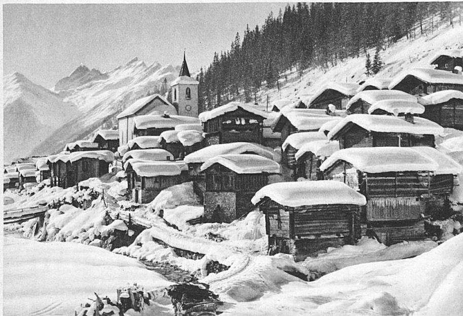
Le Lötschental ouvre sa première école de ski – Im Lötschental, dem neuen Walliser Skigebiet an der Lötschberglinie, wird eine Skischule eröffnet