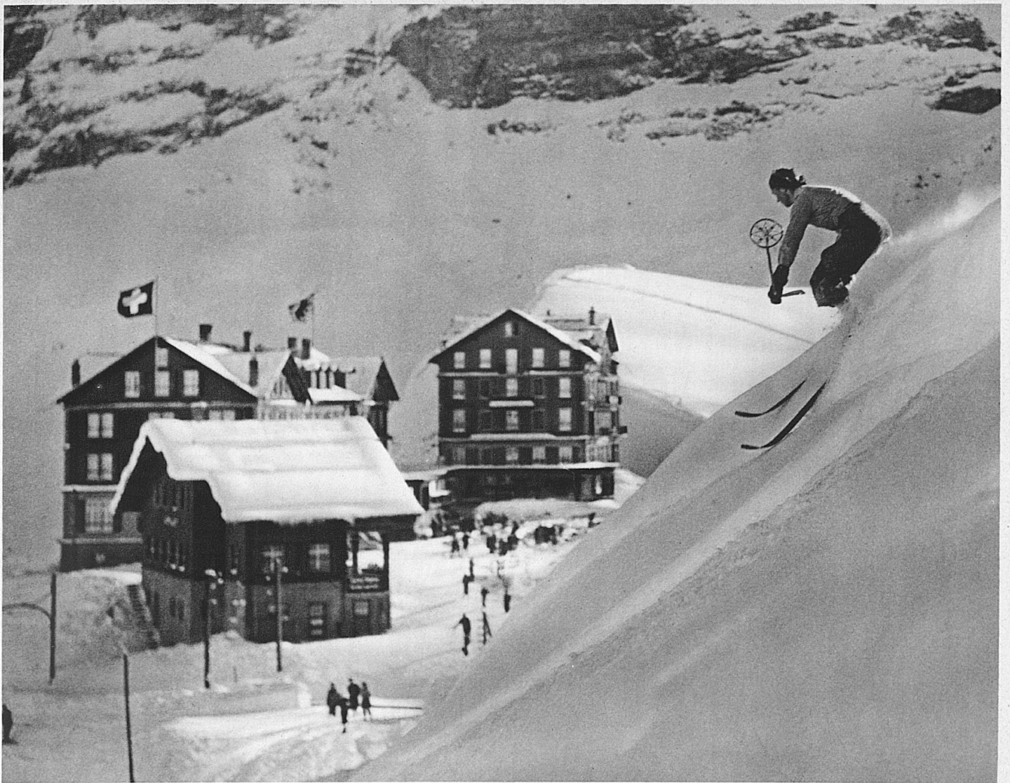
A la Petite-Scheidegg – Rassige Schussfahrt auf der Kleinen Scheidegg

dure que le temps de la neige, de la dernière fleur d'automne à la première du printemps. Qu'à cela ne tienne: d'année en année nous voyons les skieurs prolonger leur règne en poursuivant la neige dans ses retraites d'été. La religion du ski-toute-l'année compte déjà pas mal d'adeptes. Mais l'adhésion progressive des masses et des classes au culte des lattes sacrées prend toute l'importance d'un phénomène sociologique, dont les conséquences lointaines sont difficiles à prévoir. Un autre inconvénient appréciable du ski, c'est qu'il ne fait vitesse qu'à la descente, et que, la descente achevée, il s'agit de la remonter. C'est alors que ce poids, dont on se croyait heureusement affranchi, se rappelle douloureusement à vous. Mais ici de nouveau l'homme né-malin tourne la difficulté. Un peu partout déjà le monte-pente, ingénieuse combinaison d'un câble et d'une antenne, le ramène sans douleur à son point de départ, les téléphériques enjambant les abîmes vous enlèvent à de fabuleuses altitudes. Ne cite-t-on pas le cas de l'un de ces furieux descendeurs, qui, en exploitant savamment la crémaillère de la Parsenn, a réussi à totaliser dix descentes complètes en un jour? Il ne faisait qu'anticiper. Demain le dernier des skieurs en fera davantage.