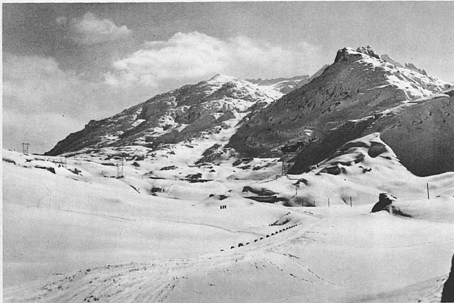
Champs de ski du Gothard, côté Tessin – Skigebiete auf der Tessinerseite des Gotthardmassivs