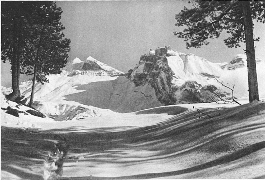
Sur les hauteurs de Kandersteg – Doldenhörner und Fisistöcke bei Kandersteg