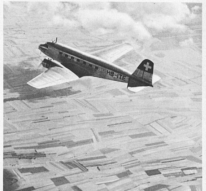
A Swissair Douglas machine high above the plains of Northern France, speeding at 200 m. p. h. towards the Swiss Alps