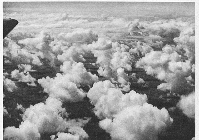
A huge sea of cloud covers the Continent, piercing it, the plane emerges into clear sunshine

Small wonder that visitors to Switzerland are becoming more and more air-minded. They eliminate the long train journey at night and the Channel crossing, thus gaining almost a whole day. The advantage of this need not be commented on, especially for those whose winter holidays are too short. And who ever spent a winter holiday in Switzerland that was otherwise?