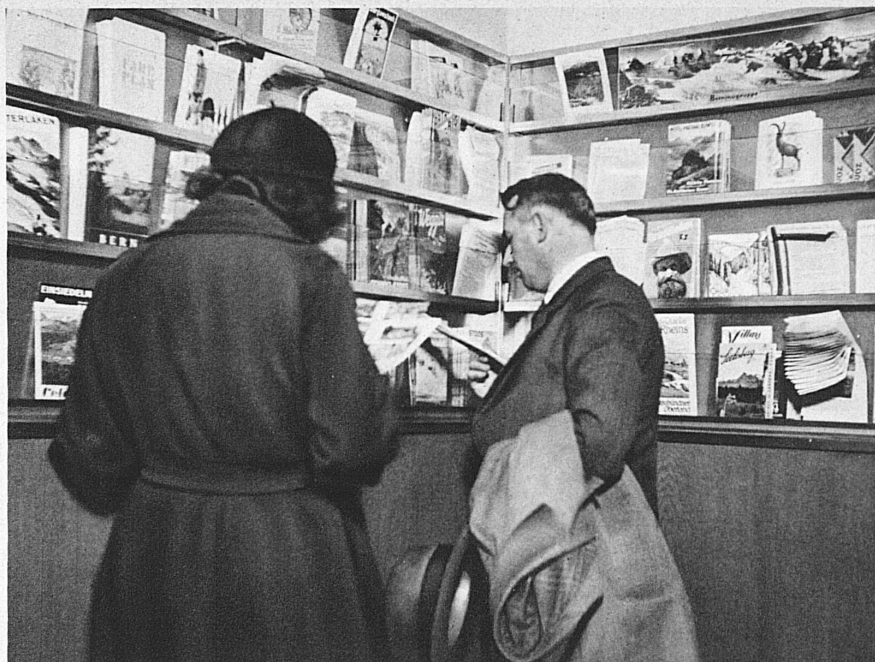
Bitte bedienen Sie sich! — Prière de se servir!

So ist die Auskunft heute zum wohl sichtbarsten Instrument eines Kundendienstes geworden, mit dem die Bahnen dokumentieren wollen, dass nicht das Publikum für sie, sondern sie für das Publikum da sind E. Gr.