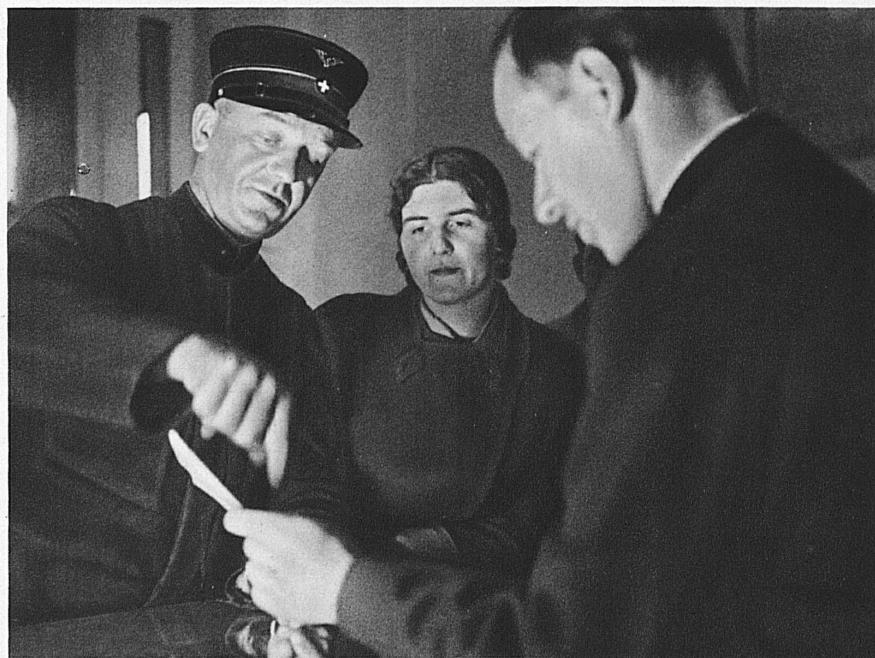
Ein umstrittener Fahrausweis — Un titre de transport contesté