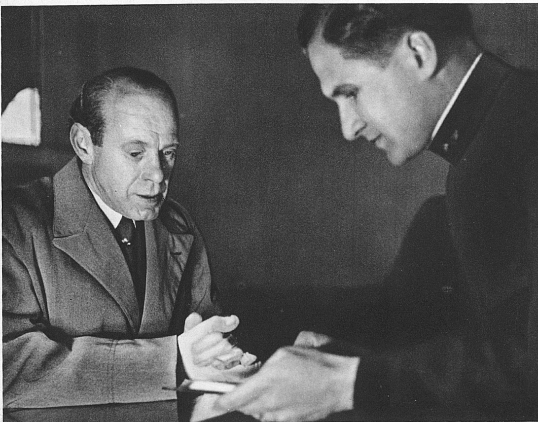
Was nun? Mein Schnellzug ist mir weggefahren - Que faire? je viens de rater mon direct

und sie über alles Wissenswerte zu belehren, was sie für eine Fahrt innerhalb und ausserhalb der Schweiz zu erfahren wünschen. Und dessen gibt es zur Genüge: Bis zu 700 Fragen — mündliche und telephonische — stürmen beispielsweise an Tagen des Hochbetriebes auf die vier Beamten in der Auskunft des Zürcher Hauptbahnhofes ein, und jede will individuell beantwortet werden. Was sich auf die schweizerischen Hauptstrecken bezieht, macht freilich die geringste Mühe: man wecke einen Auskunftsbeamten nachts aus dem Schlaf, und er wird dir sämtliche in seinem Bezirk ankommenden Züge in jeder verlangten Reihenfolge aus dem Gedächtnis aufsagen können.