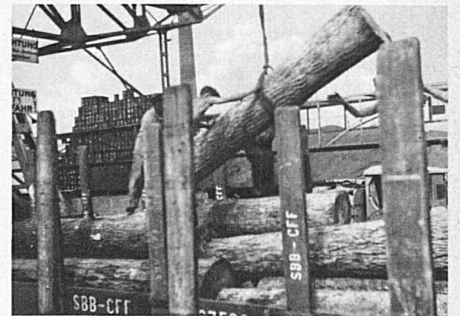
Das Hickoryholz wird aus den Rheinkähnen auf die Eisenbahnwagen umgeladen

Vous pouvez vous procurer au guichet de la gare des bons pour un ou plusieurs voyages en Suisse , et faire sous cette forme de très beaux cadeaux de Noël. Les bons peuvent être établis pour tous les genres de billets. Ceux-ci sont délivrés, sans attestation spéciale, à quiconque se présente avec le bon dans les trente jours.