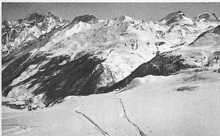
Blick auf das Skigebiet Riffelalp, Abfahrt vom Blauerhd