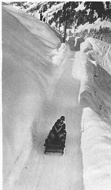
Piste de bob d'Engelberg