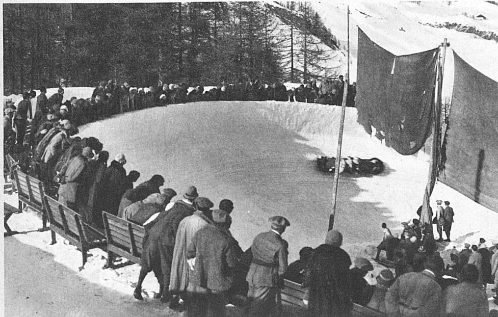
Le virage de Simmy Corner, piste du championnat mondial