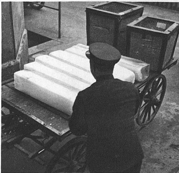
... und die Körbe, auf Karren verladen, wandern in kalter Nachbarschaft der Eisklötze, die jeder Speisewagen mit sich führt, zum Bahnhof ...