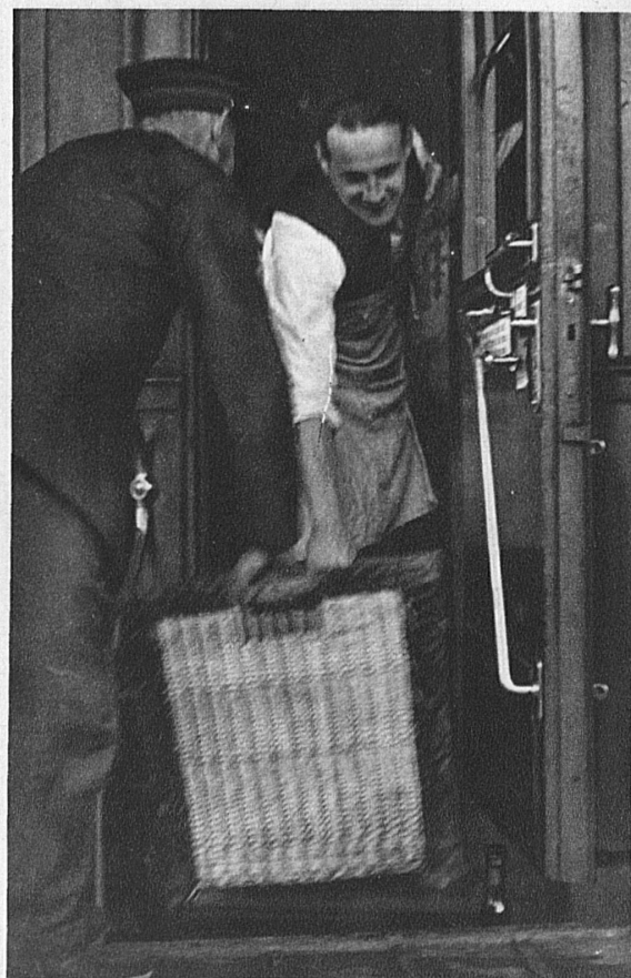
... wo das Personal schon empfangsbereit ihrer Entgegennahme harrt