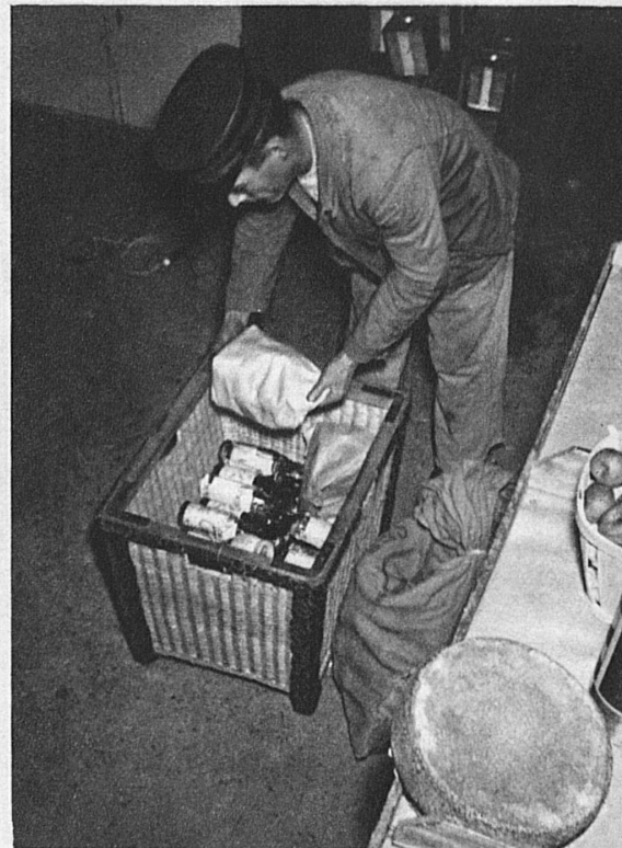
... und schon werden sie von fleissigen Händen zusammengepackt