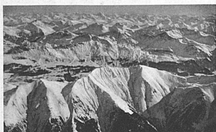
Ueber der Pracht der winterlichen Hochalpen