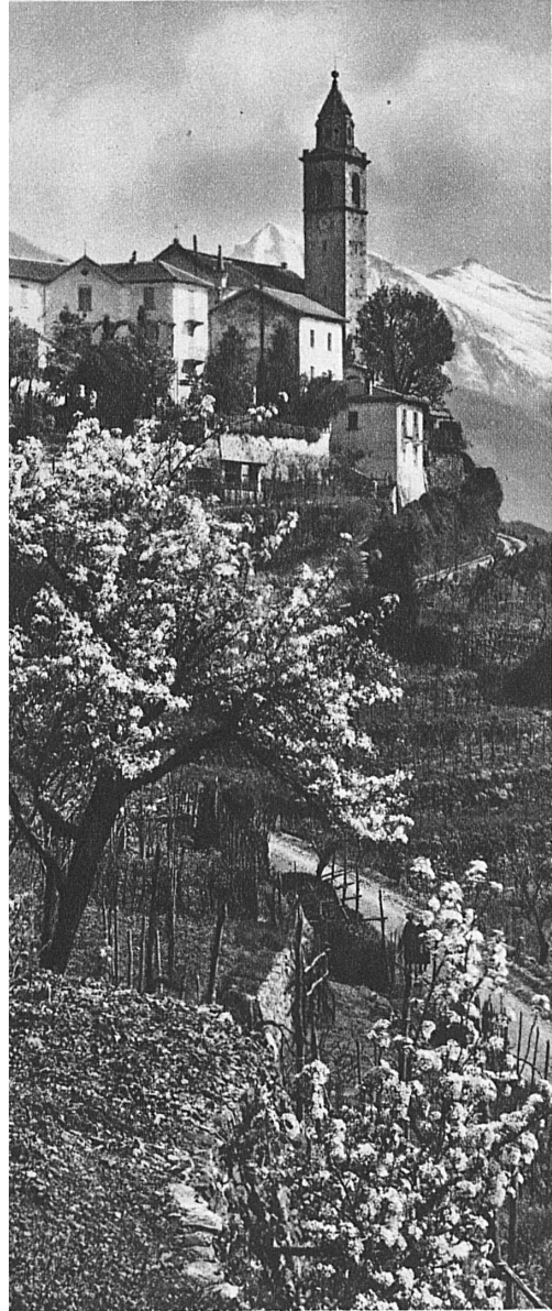
Printemps à Locarno

Deux lumières. — Deux mondes. Le soleil des midis et le soleil des glaces en une saison!... En une saison? Oh! à peine: en quatre heures.