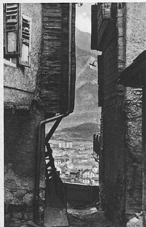
Sierre, le vieux et le neuf