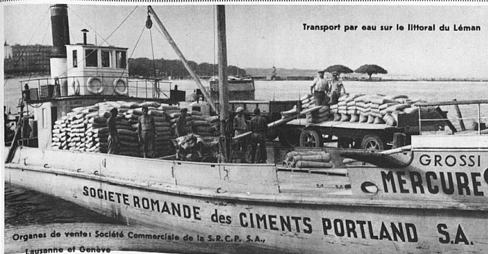
Transport par eau sur le littoral du Léman

de notre tourisme: ce qui se paie et ce qui se mange — les tarifs et la gastronomie. Ce dernier thème donnera lieu à diverses démonstrations pratiques où toutes nos cuisines cantonales et régionales fourniront leur appoint et délégueront leurs produits et leurs chefs, en sorte que le troisième Congrès du Tourisme s'annonce sous la délectable enseigne d'une Fête de la Gastronomie.