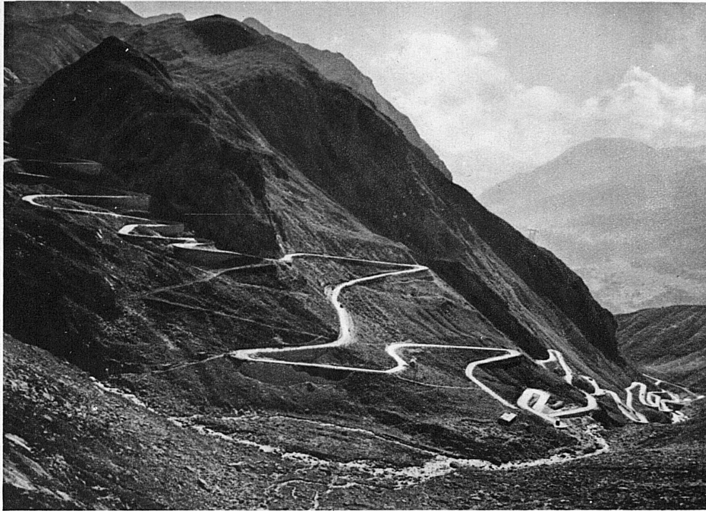
Die Gotthardstrasse führt durchs Herz der Schweiz vom Vierwaldstättersee über den altberühmten Passberg in den Tessin

Z weifach trennen die Schweizer Hochalpen Nord und Süd. Rhone und Rhein gruben in den Wall ihre tiefen Täler ein. Im Quellmassiv, im Gotthard nur, vereinigen sich die beiden Mauern zu einer Bastion.