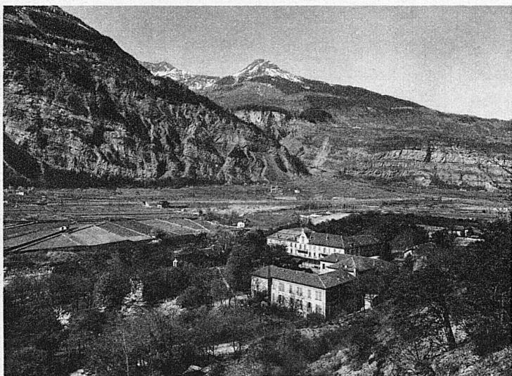
Lavey-les-Bains im Rhonetal (Vallée du Rhône)

La durée moyenne des bains est d'une demi-heure. A Loèche on la pousse avec d'excellents effets jusqu'à 3 et 5 heures. Ces eaux de Loèche sont connues depuis des siècles, bien avant que la station devint le rendez-vous des skieurs et des alpinistes. Un train à crémaillère relie à la ligne du Simplon cette élégante villégiature, qu'on s'étonne de trouver dans l'un des plus sauvages et grandioses décors du Valais.