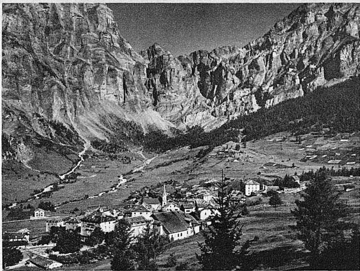
Leukerbäd im Wallis – Loèche-les-Bains