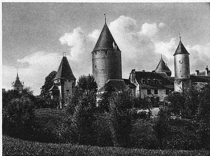
Das stolze Schloss Estavayer unweit von Bad Yverdon – Le château d'Estavayer non loin d'Yverdon-les-Bains sur le lac de Neuchâtel