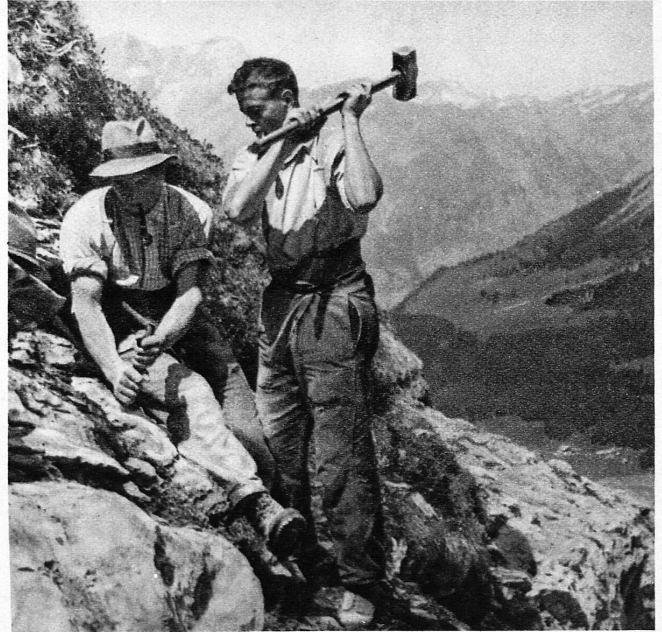
Der Weg wird gebahnt. Zwei Meisterschafts-Skiläufer am Bau der Anlage – On ouvre le sentier dans la roche