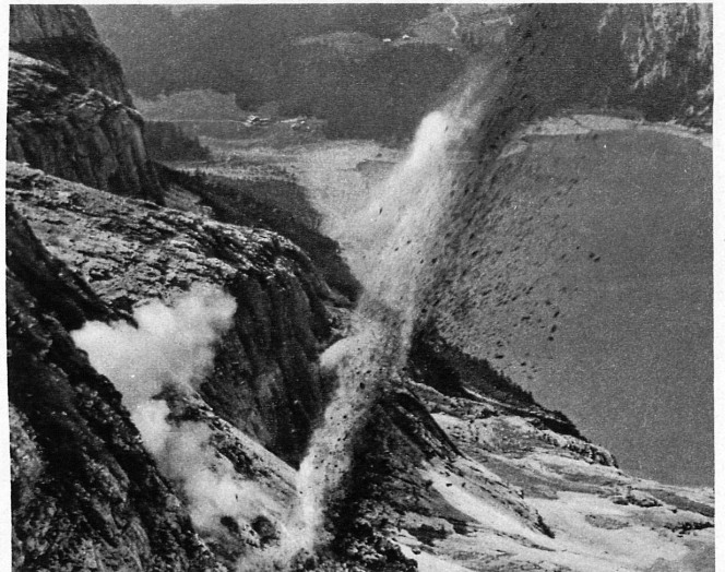
Sprengschuss – in der Tiefe der Oeschinensee – Un beau coup de mine dans les échos du Lac d'Oeschinen