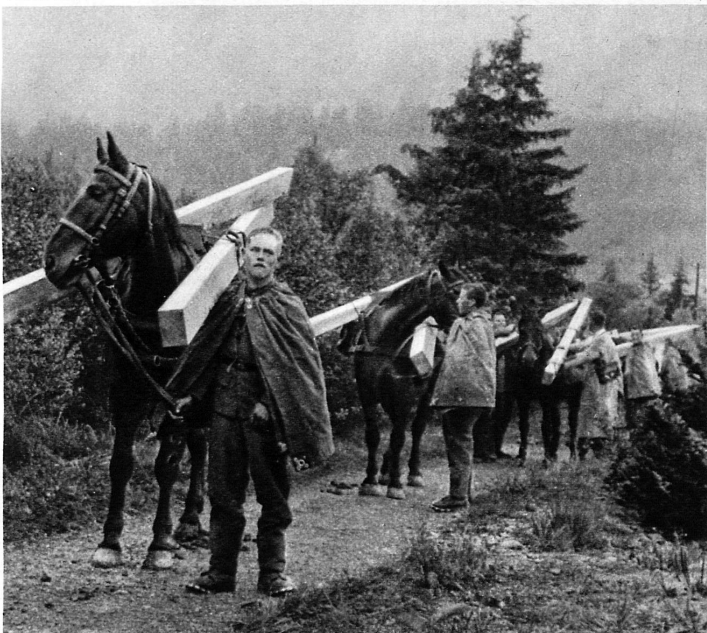
Säumerrekruten transportieren Balken für den Bau der Frundenhornhütte – Les recrues d'un convoi de montagne prêtent leur aide