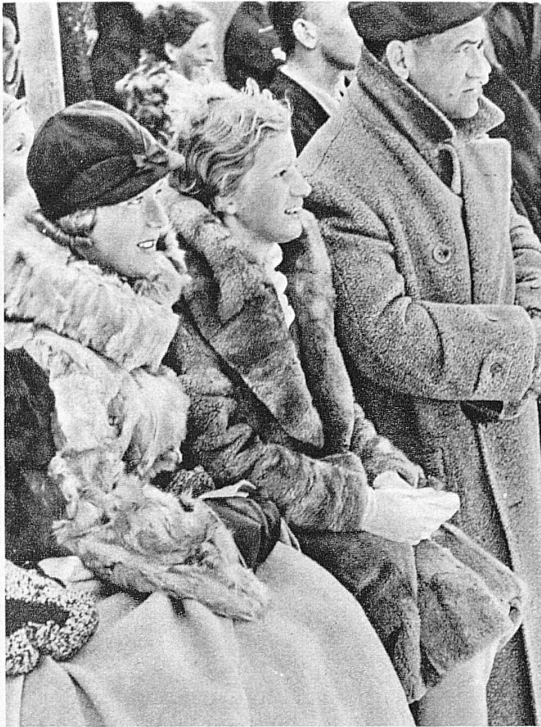
Spectators - La galerie - Zuschauer - Spettatori

Et les grandes villes ne sont pas loin, avec leurs théâtres, leurs concerts et leur vie intellectuelle, leurs musées et leurs collections, auxquels on fera bien de rendre visite soit à l'aller soit au retour.