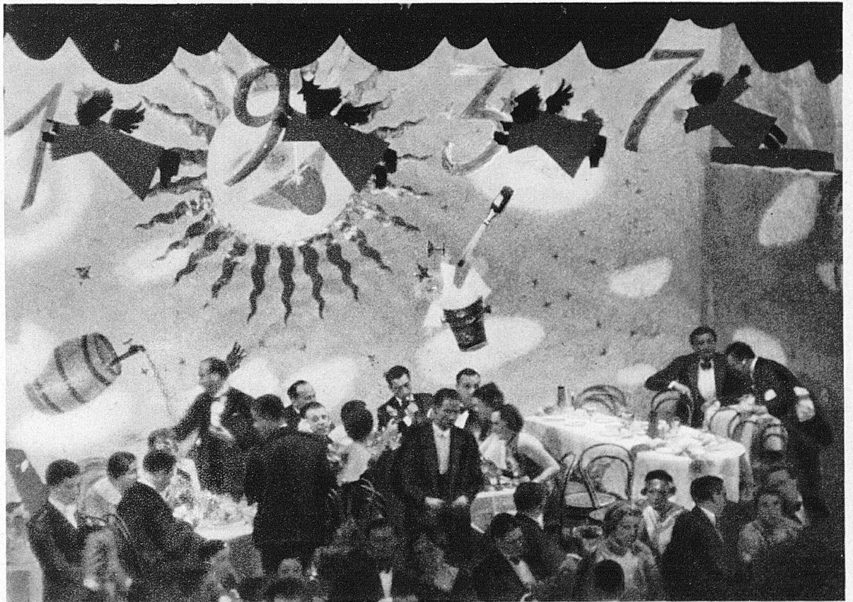
Phot.: Jost & Steiner, Michel, Nino