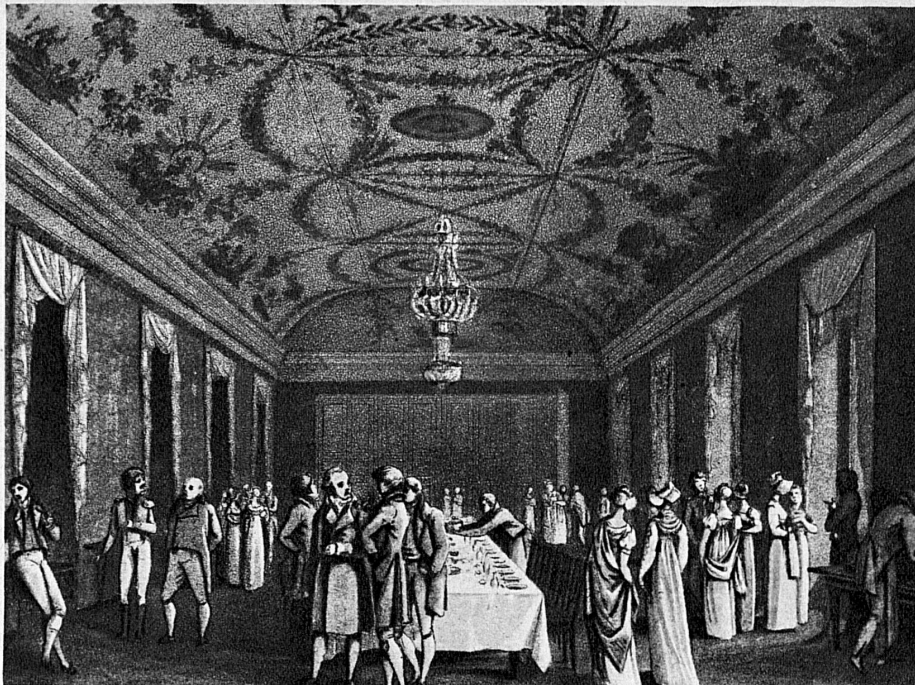
Der grosse Speisesaal in Bad Schinznach zu Beginn des 19. Jahrhunderts - La grande salle à manger des bains de Schinznach au début du XIX me siècle

Il y a 4000 ans, les habitants de la Haute-Engadine connaissaient déjà les effets bienfaisants des sources de St-Moritz, ainsi que nous le prouve la découverte d'un captage de source datant de l'époque du bronze. De nombreux vestiges de bains remontent à l'époque romaine. Plusieurs stations de cure encore connues et appréciées aujourd'hui, par exemple Baden, Schinznach, Yverdon et Lavey dans la vallée du Rhône, servaient de lieux de villégiature aux légionnaires et fonctionnaires romains chargés de garder les frontières de l'Empire et d'assumer l'administration de notre pays. Mais c'est à partir du moyen âge et de la Renaissance que les stations balnéaires suisses connurent leur plus belle période de prospérité, car à partir de ce moment la science moderne découvre peu à peu les causes chimiques de l'effet thérapeutique des sources thermales, et l'analyse scientifique permet dès lors un classement toujours plus rationnel des sources d'après leurs vertus thérapeutiques, en même temps que des cures de plus en plus appropriées et systématiques. Pendant des siècles, les cures de bains ont constitué la méthode la plus répandue et la