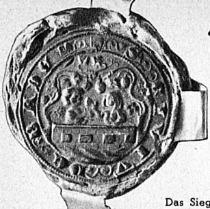
Das Siegel von Baden Le sceau de Baden

Cures balnéaires suisses de l'ancien temps