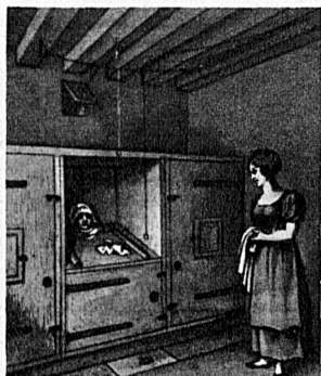
Dampfbad im alten Baden. Aquatinta von F. Hegi aus dem Jahr 1827 - Bain de vapeur dans l'ancien Baden