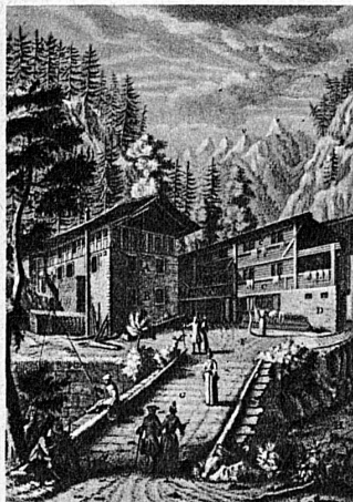
Das Weissenburger Bad im thüring. Weissenburger Gebirge. Der Ort Weissenburg, dessen Quelle 1602 auf obrigkeitliche Anordnung der Gnädigen Herren von Bern gefasst wurde. Unser Stich zeigt das Bad im 18. Jahrhundert – A gauche: Weissenbourg dans le Simmental, dont la source a été captée en 1602 sur l'ordre de Leurs Excellences de Berne. Notre gravure représente l'état de ces bains au XVIII e siècle

teten nun eine immer bessere Einteilung der Quellen nach ihren Heilanzeigen und eine immer systematischer durchgeführte Badekur. Jahrhundertlang war das Baden geradezu die meistgeübte und sicherste Methode im Kampfe gegen die Krankheit. Die gewaltigen neuen Erkenntnisse der Medizin haben die von Aristoteles ausgesprochene Wahrheit «Das Wasser aber ist das Beste» nicht entkräftet. Der Wert der natürlichen Heilmittel ist unzerstörbar. Und vor den mittelalterlichen und antiken Bädern haben unsere modernen Heilbäder noch das voraus, dass neben den Quellen überall die neuen, ergänzenden Kurmittel zur Verfügung stehen.