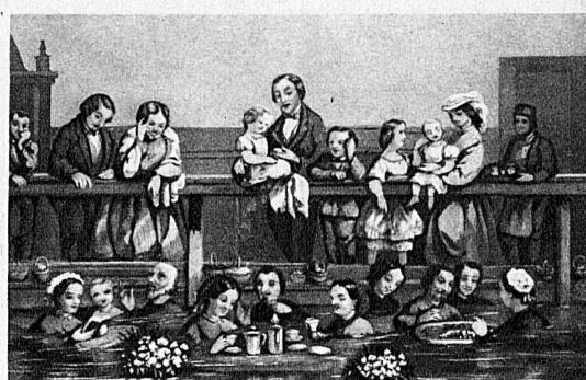
Idyll aus Leukerbad um die Mitte des vorigen Jahrhunderts - Idylle à Loèche-les-Bains, milieu du XIX me siècle

plus efficace dans la lutte contre les maladies de tout genre. Les progrès immenses réalisés dans la pratique de la médecine n'ont fait que confirmer l'aphorisme d'Aristote que « l'eau est le bien suprême ». La valeur thérapeutique des remèdes naturels est plus reconnue que jamais. Mais nos cures de bains présentent sur celles d'autrefois l'immense avantage qu'à l'efficacité des sources thermales viennent s'ajouter aujourd'hui les mille et une ressources de la thérapeutique moderne.