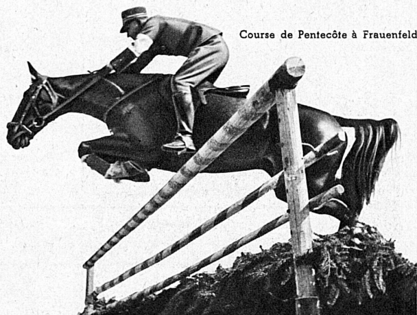
Course de Pentecôte à Frauenfeld