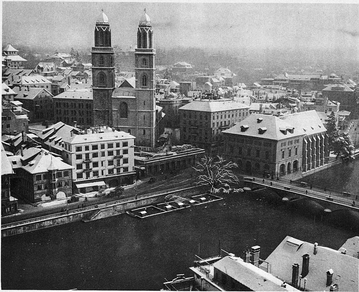
Grossmünster und Altstadt – La cathédrale et la vieille ville