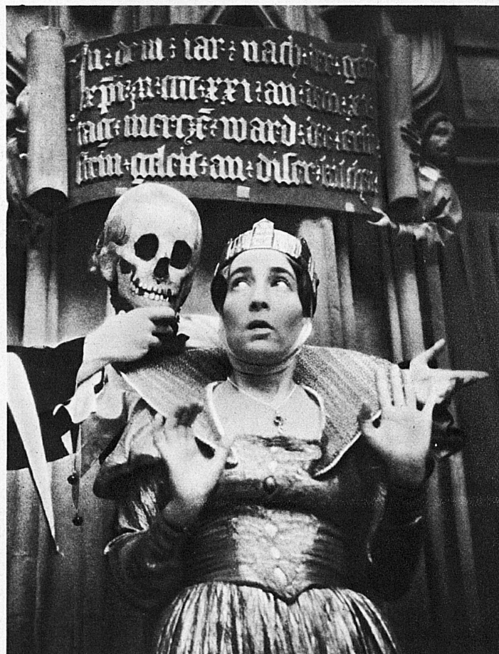
Die Kaiserin, vom Tode überrascht — L'impératrice, surprise par la mort

Entouré de trois côtés par de vieilles maisons, et fermé par celle des façades de la cathédrale où se trouvent l'entrée et la tour, le « Münsterplatz » de Berne est un emplacement idéal pour des représentations en plein air. Le mystère « Der Ewige Reigen », qui y sera jouée 11 fois pendant le mois d'août, est une nouvelle version de la Danse des morts; les acteurs et figurants seront au nombre de plus de 120. Lorsque l'on voit apparaître successivement la Mort comme sacristain, fou, guerrier, faucheur, marchand ou voyageur, cette solennelle cantate rappelle vraiment la profonde pensée du poète Rilke, selon laquelle chacun a sa propre Mort. Un choix des plus belles mélodies populaires de la période du XIV me au XVIII me siècle agrémentent cette pièce et lui donnent un relief saisissant. Les représentations auront lieu les 9, 11, 14, 16, 18, 20, 21, 23, 25, 27 et 29 août.