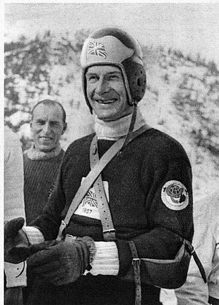
F. Mc Evoy, Bobletweltmeister 1937 - M. Mc Evoy, champion du monde de boblet 1937