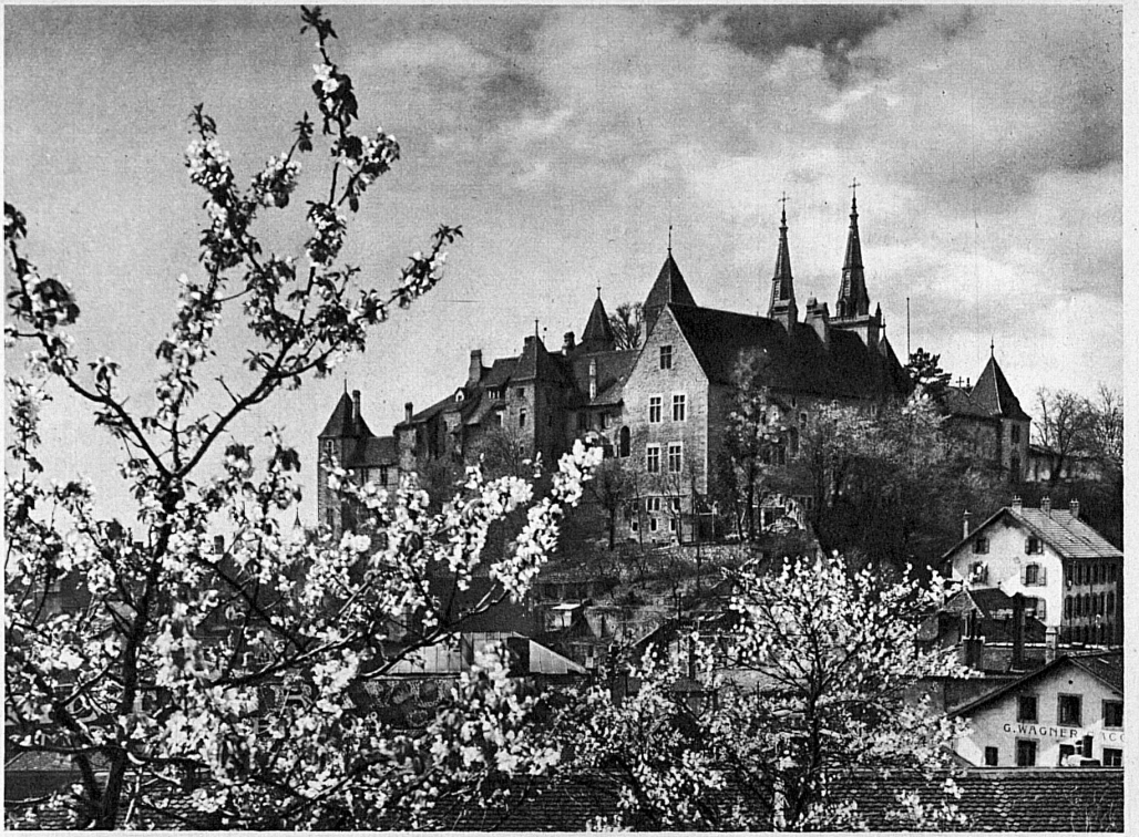
Spring at Neuchâtel - Frühling in Neuenburg - Printemps à Neuchâtel