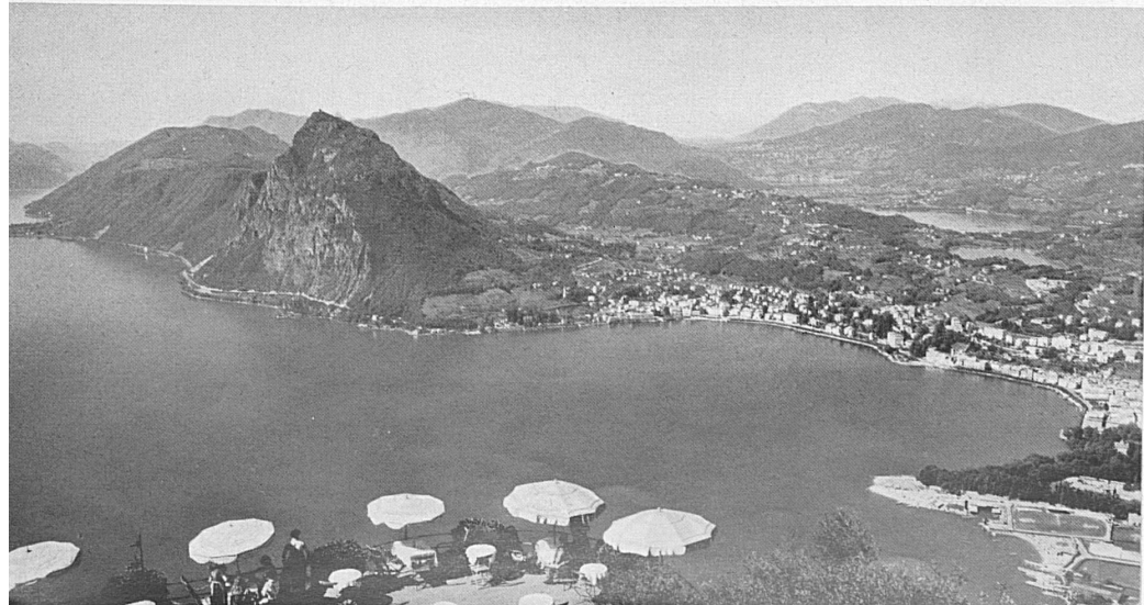
Unten: Die Bucht von Lugano im Südtessin, links der Monte San Salvatore. Darüber: ostschweizerische Vor-alpenlandschaft in den Appenzellerbergen