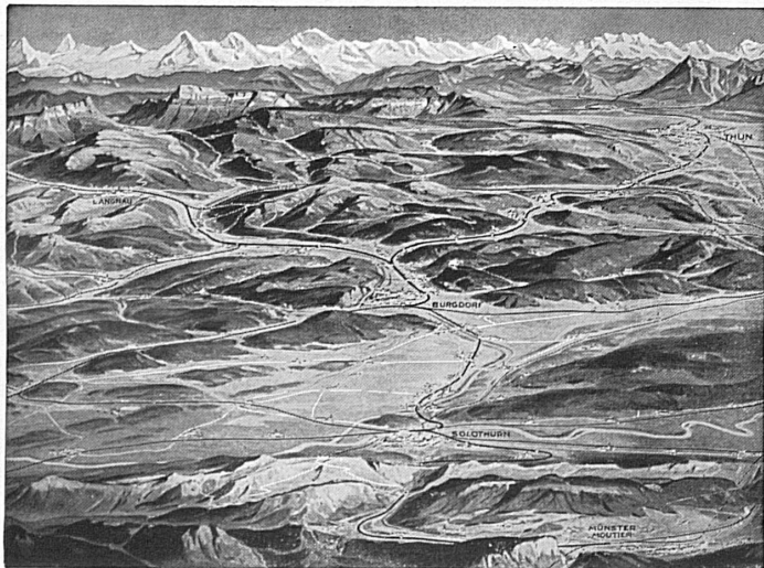
Blick von den Jurahöhen des Weissensteins nach Süden - Ausgangspunkte: Stationen Gänsbrunnen und Oberdorf (Solothurn) - Autokurs Gänsbrunnen-Weissenstein. Sonntagsbillette zu reduzierten Preisen