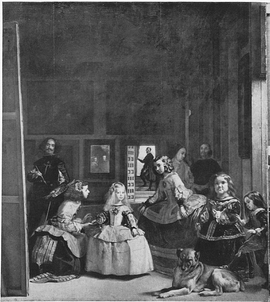
Velasquez: Les Ménines de la cour espagnole — Die Zwerginnen des spanischen Hofes (Prado)