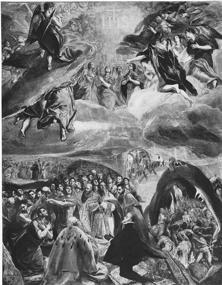
Greco: Le songe de Philippe II — Das Gesicht Philipps II. (Escorial)

voilà tout Goya en trois mots. Sentir, c'était déjà pour lui agir; agir, c'était se débrouiller; et comprendre, c'était se persuader d'agir encore et de plus belle. Toutes ces puissances se déclenchaient en lui si vite qu'elles en arrivaient à travailler de concert. Et c'est me semble-t-il, un beau miracle sombre que de créer comme Goya l'harmonie dans la violence. Ajoutez que dans toute scène de la vie, volontiers il retrouve les grands traits d'un drame éternel. Alors, enveloppée tout à coup d'un éclat mystérieux, et qui la recule devant son esprit, sans la reculer dans l'espace, la réalité lui apparaît proche et lointaine. Or le point de vue d'un Goya, toute l'école espagnole le justifie. Visiblement, pour elle, une œuvre n'est belle que si, participant de deux mondes à la fois, elle procède de deux visions, l'une qui enregistre le réel, et l'autre qui le transfigure en le ramenant à une vue de l'esprit. Autant dire qu'alors l'art met en jeu, par voie de transmission, toutes les énergies de l'homme et pour conclure entre elles un pacte éblouissant où la violence de leur conflit se reconnaît aux perfections de leur accord.