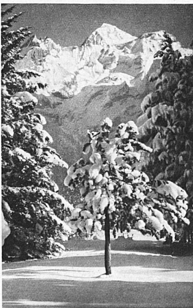
Kandersteg (Oberland bernese — Oberland bernois — Bernese Oberland)