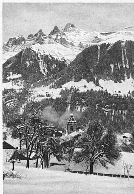
Champéry (Vallese — Valais)

Oggi non v'è più persona, a qualunque ceto appartenga, che non sia convinta degli effetti salutari delle vacanze invernali. La passione degli sport invernali, fonte di energia e di piacere, ha oramai conquistato il mondo. In nessun periodo dell'anno l'uomo sente il bisogno di muoversi a proprio agio nella luce e nel sole, come in inverno. Mai come in questa stagione si avverte l'enorme contrasto fra il clima del piano, avarissimo di sole, e l'atmosfera vivificante delle altitudini.