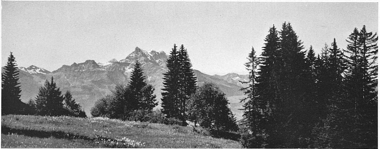
Die Dents du Midi von Villars aus gesehen — Les Dents du Midi vues de Villars