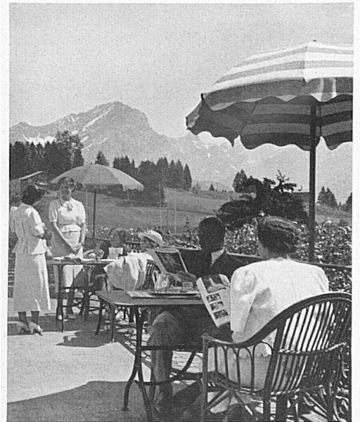
Ruhe und Erholung, Sport und Geselligkeit bietet der Schweizer Höhenkurort seinen Gästen Les stations suisses d'altitude vous offrent le repos, le sport et les agréments de la vie mondaine