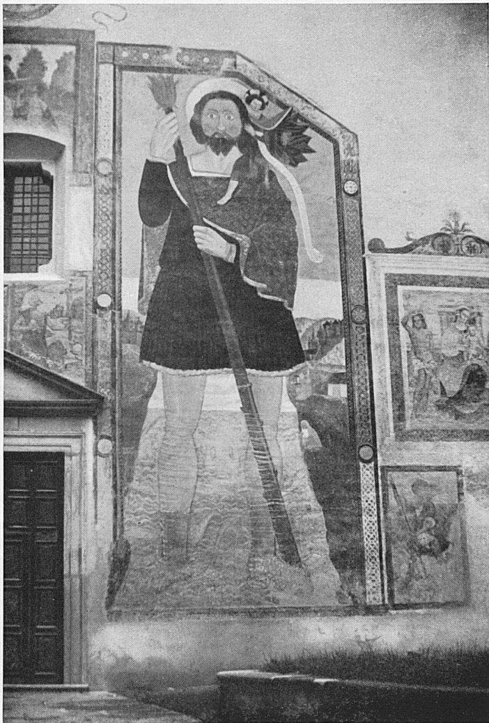
Le Saint Christophe de Malvaglia St. Christoph von Malvaglia St. Christopher at Malvaglia