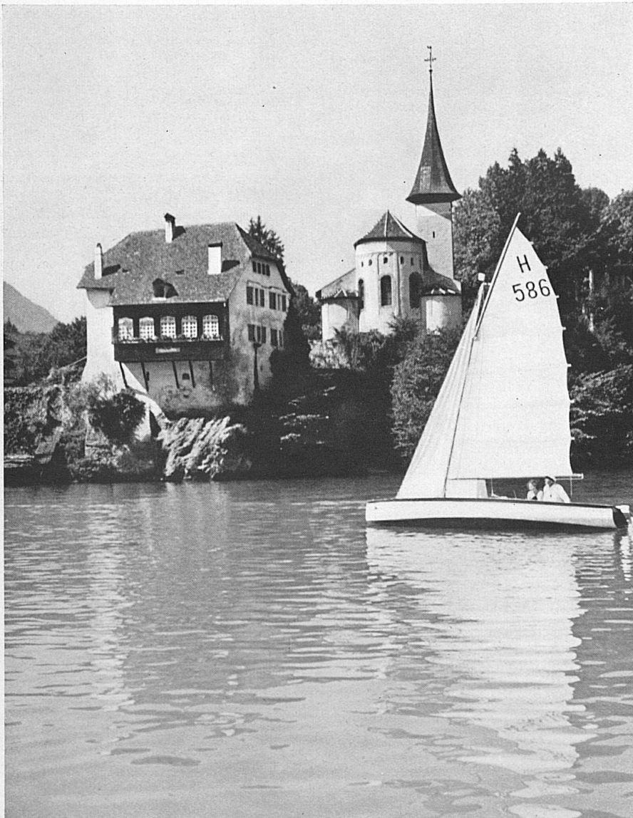
Die romanische Kirche von Spiez am Thunersee — L'église romane de Spiez aux bords du Lac de Thoune — Roman Church at Spiez on the Lake of Thun

Der Wanderer, der an solchen Tagen einem der Voralpen- oder Juragipfel einen Besuch abstattet, die zu Hunderten und Tausenden den Tälern und Seebecken entsteigen und die man die wahren Ob-