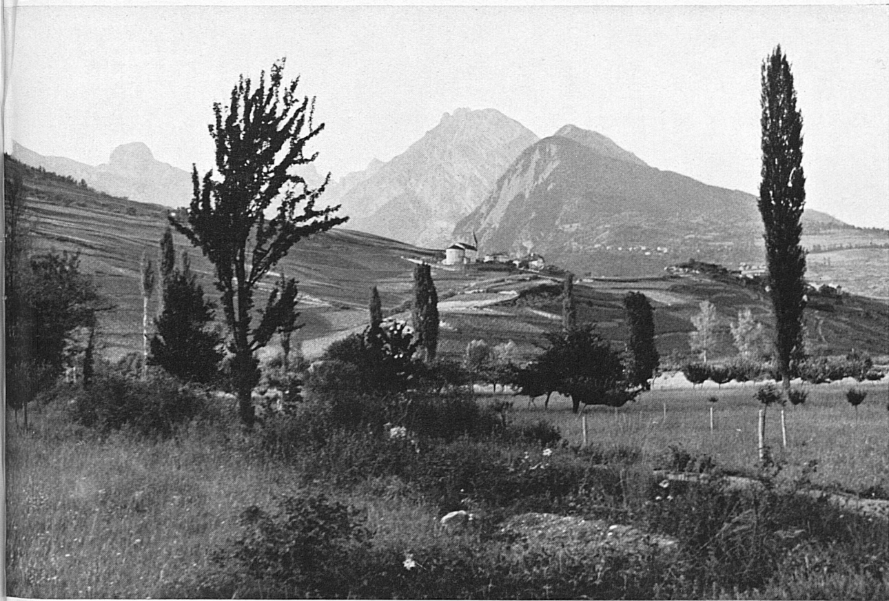
Conthey und das Rhonetal — Conthey (Valais) et la vallée du Rhône — Conthey and the Rhone-valley (Valais)