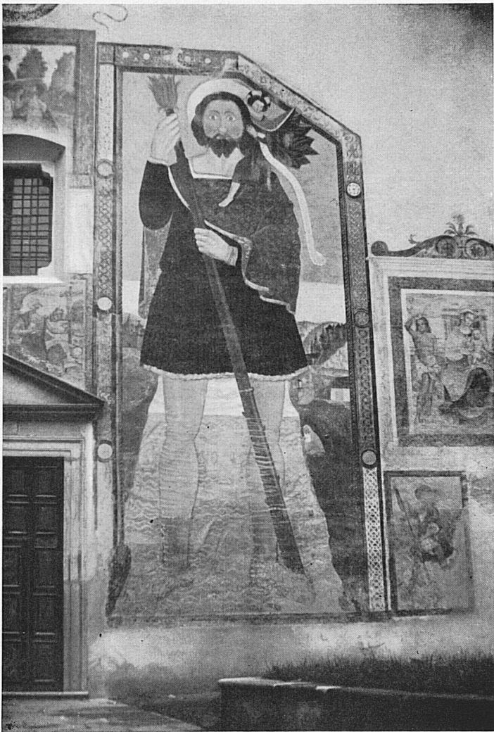
Le Saint Christophe de Malvaglia St. Christoph von Malvaglia St. Christopher at Malvaglia