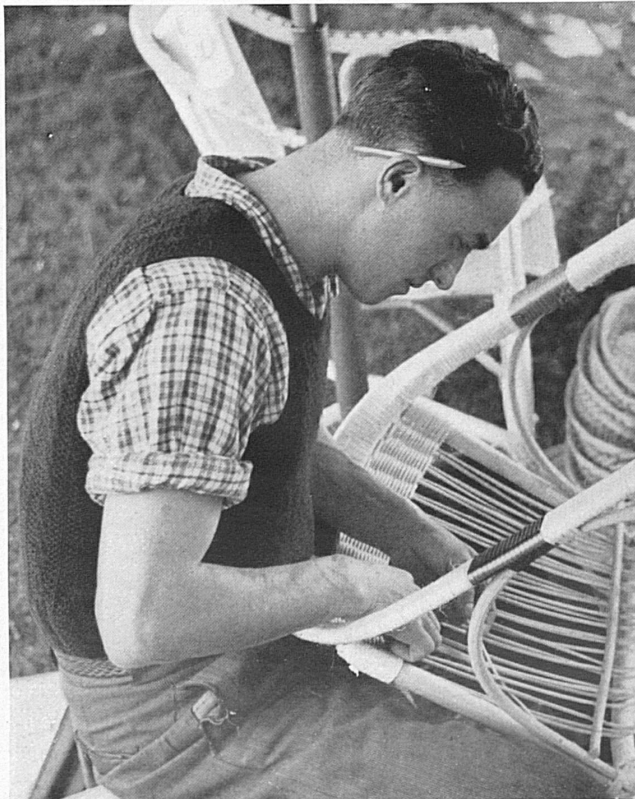
Travaux et fêtes du peuple tessinois