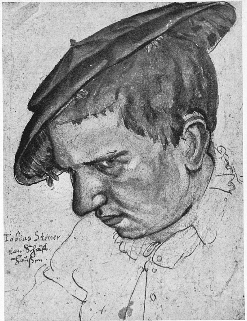
Selbstbildnis Tobias Stimmers. Aquarellierte Federzeichnung (Donauveschingen). Die Zeichnung muss um 1563 entstanden sein, in einem Zeitpunkt, da sich der junge Künstler fern von der Heimat aufhielt - Autoportrait de Tobias Stimmer dessin teinté, vers 1563) Donauveschingen