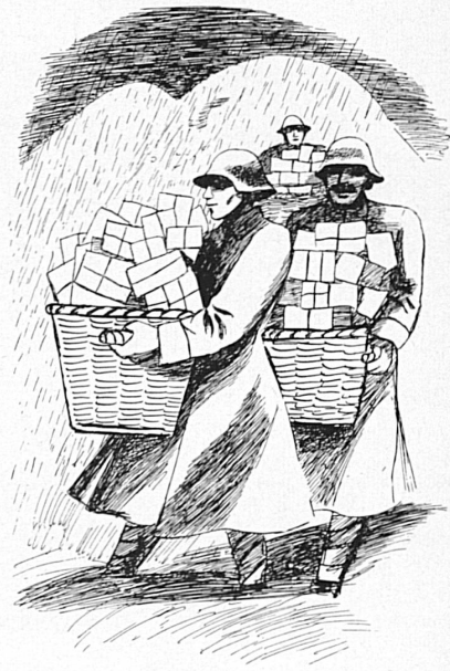
Zeichnungen: Erika Mensching