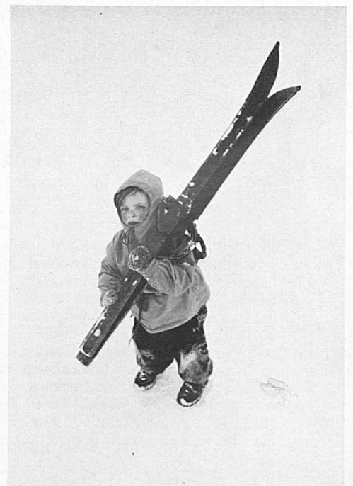
Sonniges Braunwald · Braunwald au soleil!