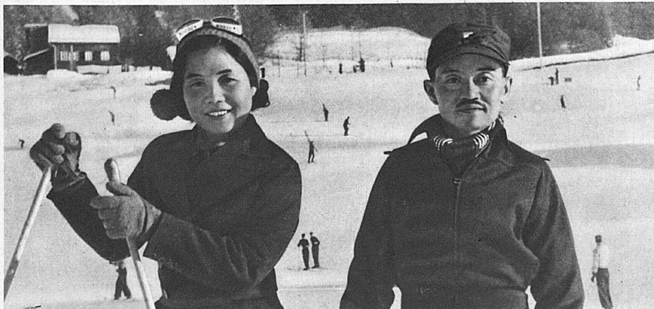
The ex-King and ex-Queen of Siam on a Winter sports holiday at Wengen — L'ex-roi et l'ex-reine de Siam s'adonnant aux sports d'hiver, à Wengen — Der Exkönig und die Exkönigin von Siam beim Wintersport in Wengen

A glance through the Visitors' List in a large Swiss winter sports resort reveals a surprisingly large number of nationalities and an almost unlimited diversity of social ranks. It is quite fascinating to make one's observations in this connection, for a large hotel during the winter season forms a little world of its own. But one thing is significant — all these people, whether royalty or ordinary mortals, whether statesmen or film stars or children, are there to enjoy themselves, and in the same manner. One and all, they are under the irresistible spell of snow and winter sports.