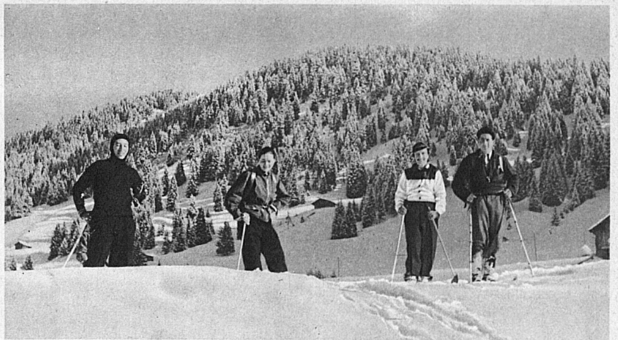
The well-known French tennis player René Lacoste (left) with his family at Villars-Chesières — René Lacoste, le célèbre champion français de tennis (à gauche) avec sa famille, à Villars-Chesières — Der grosse französische Tennisspieler René Lacoste (links) mit seiner Familie in Villars-Chesières