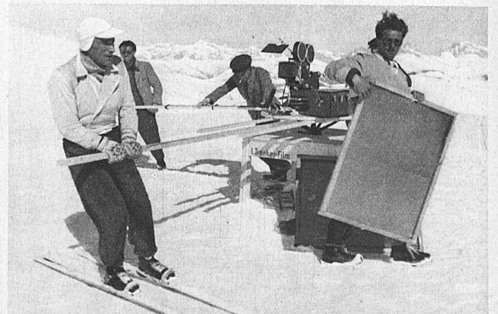
Right: Luis Trenker filming on the Parsenn near Davos — A droite: Luis Trenker prend un film à Parsenn près de Davos — Rechts: Luis Trenker filmt auf Parsenn bei Davos