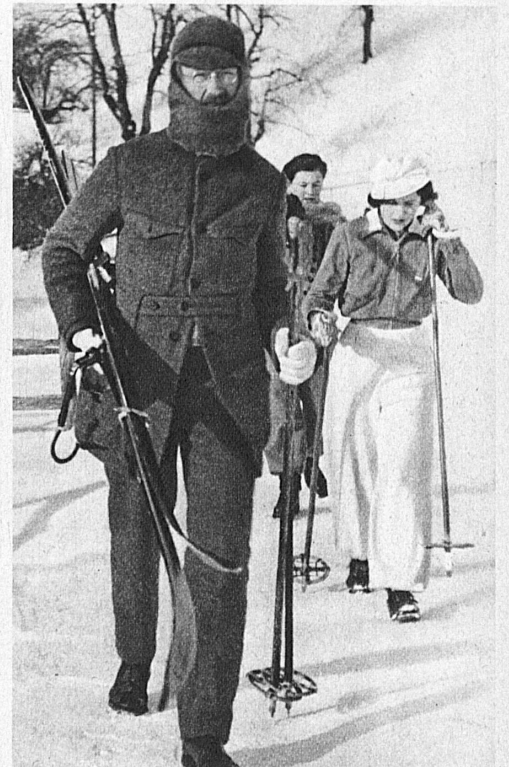
Prof. Piccard, the stratosphere explorer, at Grindelwald — Le professeur Piccard, vainqueur de la stratosphère, à Grindelwald — Prof. Piccard, der Stratosphärenflieger, in Grindelwald