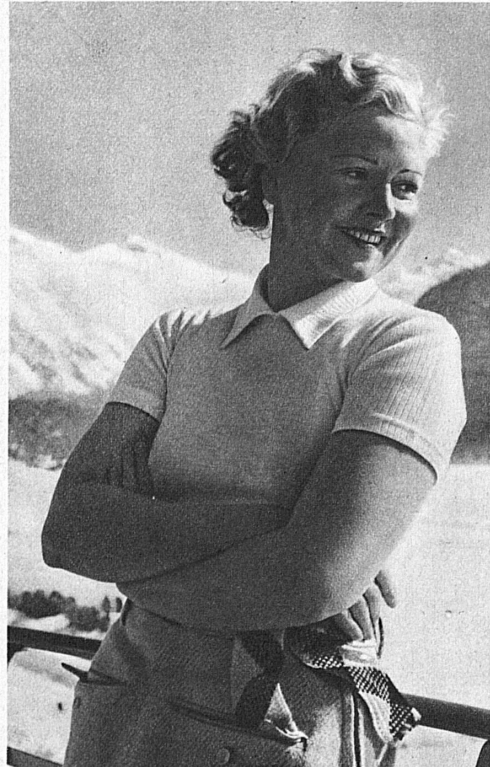
Liane Haid, German film star, at St. Moritz — Liane Haid à Saint-Moritz — Liane Haid in St. Moritz

Wer die Fremdenliste eines grossen Schweizer Wintersportplatzes durchsieht, wird staunen über die Vielzahl der Herkunftsländer, über die unübersehbare gesellschaftliche Buntheit des Publikums. Es hat seinen ganz besondern Reiz, in diese Menschheit im kleinen einzutauchen, die ein Hotel während der Saison beherbergt. Wunderbar aber ist es, zu erleben, wie alle, von der königlichen Hoheit bis zum einfachen Bürger, vom Minister und berühmten Filmstar bis zum Kinde, völlig unter dem beglückenden Zauber des Schnees und des Sportes stehen.