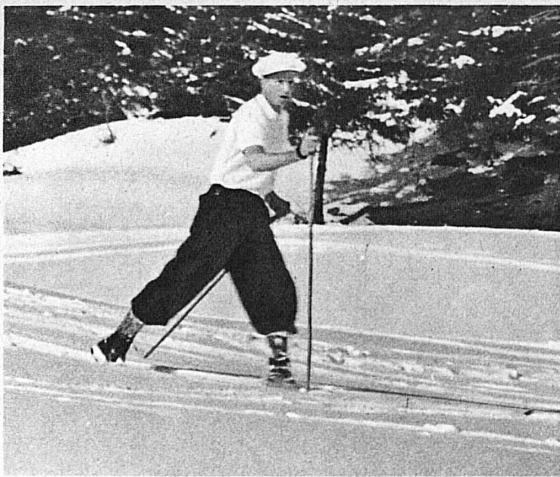
H. M. King Leopold III of the Belgians at Montana-Yermala — S. M. Léopold III, roi des Belges, à Montana-Yermala — S. M. Leopold III. König der Belgier, in Montana-Yermala