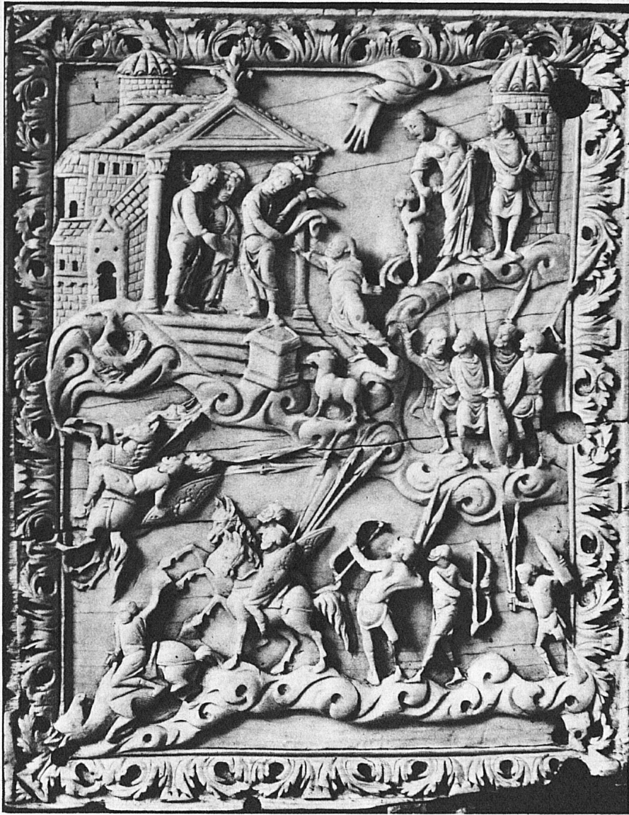
Relief d'ivoire illustrant le psaume 26. Du couvent de Rheinau, époque carolingienne, vers 870. Musée national, Zurich-Elfenbeinrelief mit Darstellung nach Psalm 26. Aus Kloster Rheinau, karolingisch um 870. Im Schweizerischen Landesmuseum, Zürich — Ivory relief illustrating Psalm 26. Carolingian work, about 870, from Rheinau Convent. National Museum, Zurich