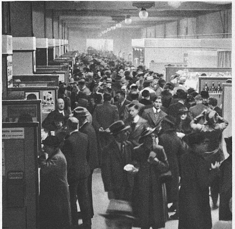
Hochbetrieb in den Messehallen — Les halles de la Foire en pleine activité — Crowded Halls of the Fair