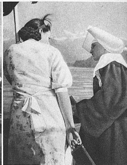
Fahrt auf dem Thunersee — Sur le lac de Thoune