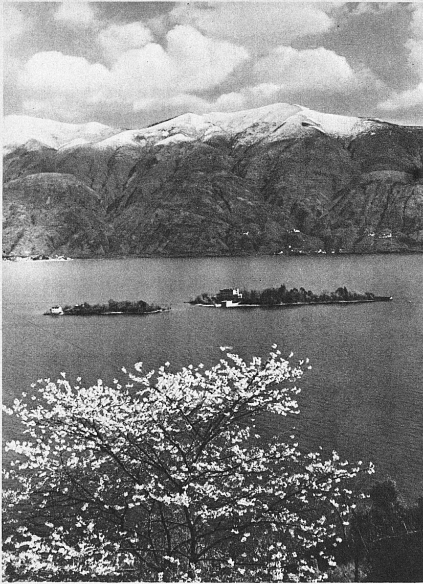
Die Brissago-Inseln im Lago Maggiore (Tessin)