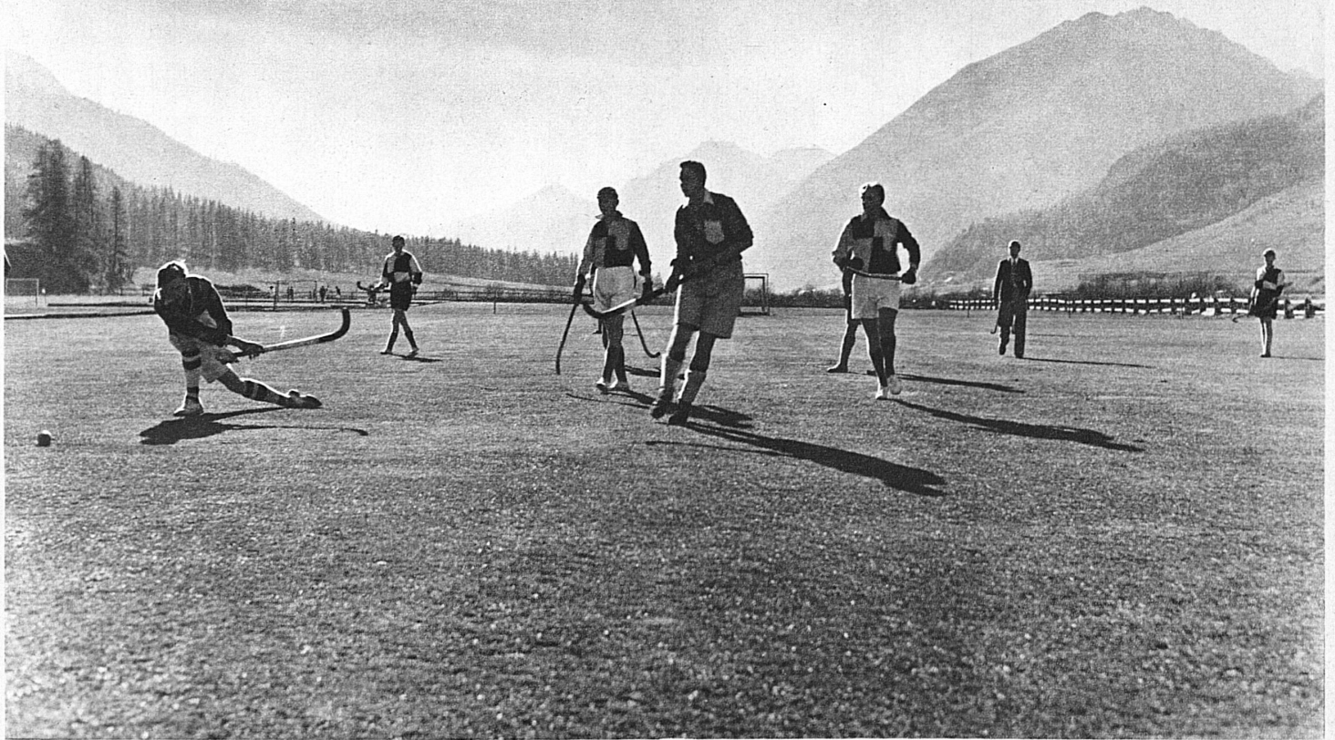
Oben: Der Sport steht hoch in Ehren. Und wo könnte man besser Sport treiben als hier im Hochalpenland! Unser Bild zeigt den einzigartigen Landhockey-Platz des Lyzeum Alpinum in Zuoz im Engadin

höhere Lehranstalten. Als Anerkennung für ihre Leistungen sind ihnen auch staatliche Prüfungsberechtigungen für in- und ausländische Examina (Maturitäten und Handelsdiplome) zugesprochen worden. Der Unterricht wird durchwegs in kleinen Klassen erteilt. Dies ermöglicht nicht nur eine weitgehende Berücksichtigung des Einzelnen, sondern fördert gleichzeitig die jugendliche Selbstinitiative. Die enge Lebensgemeinschaft zwischen Lehrern und Schülern erleichtert dem Erzieher seine vornehmste Aufgabe: stärkere Begabungen zu erkennen und vorsichtig zu lenken, schwächere schonend und ermunternd zu fördern. Dass der froh beschwingte und doch fürsorglich-verstehende Geist solcher Schulen in manchen jungen Menschen, der durch Krankheit oder sonstiges Missgeschick aus dem normalen Studiengleise herausgerissen wurde, zu frischem Mut und neuem Lerneifer erweckt, findet immer wieder seine Bestätigung. Die grosse, stille Bergwelt trägt auch zur geistigen Vertiefung bei, indem sie das Chaotische, Ungesam-