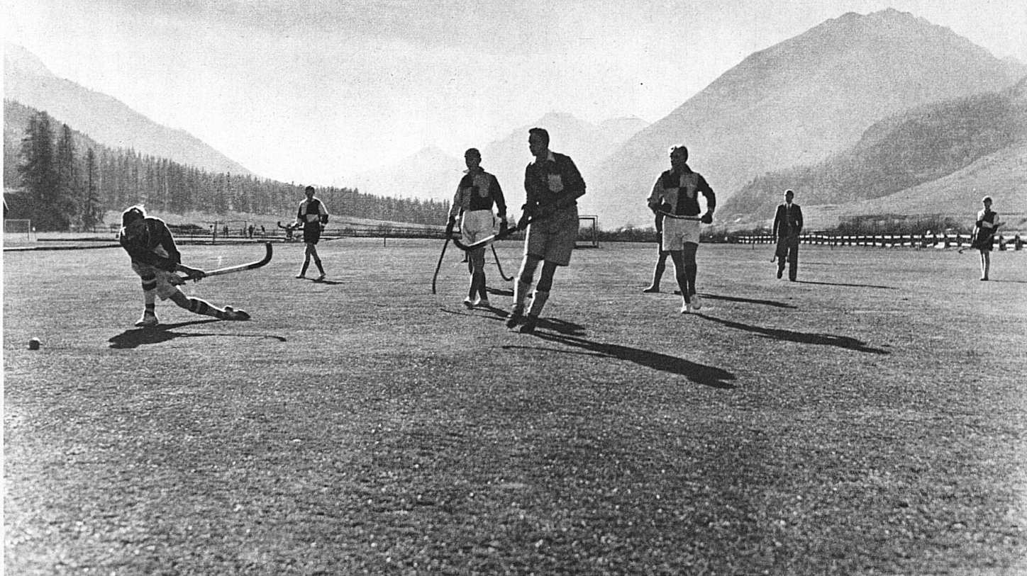
Oben: Der Sport steht hoch in Ehren. Und wo könnte man besser Sport treiben als hier im Hochalpenland! Unser Bild zeigt den einzigartigen Landhockey-Platz des Lyzeum Alpinum in Zuoz im Engadin

höhere Lehranstalten. Als Anerkennung für ihre Leistungen sind ihnen auch staatliche Prüfungsberechtigungen für in- und ausländische Examina (Maturitäten und Handelsdiplome) zugesprochen worden. Der Unterricht wird durchwegs in kleinen Klassen erteilt. Dies ermöglicht nicht nur eine weitgehende Berücksichtigung des Einzelnen, sondern fördert gleichzeitig die jugendliche Selbstinitiative. Die enge Lebensgemeinschaft zwischen Lehrern und Schülern erleichtert dem Erzieher seine vornehmste Aufgabe: stärkere Begabungen zu erkennen und vorsichtig zu lenken, schwächere schonend und ermunternd zu fördern. Dass der froh beschwingte und doch fürsorglich-verstehende Geist solcher Schulen in manchen jungen Menschen, der durch Krankheit oder sonstiges Missgeschick aus dem normalen Studiengleise herausgerissen wurde, zu frischem Mut und neuem Lerneifer erweckt, findet immer wieder seine Bestätigung. Die grosse, stille Bergwelt trägt auch zur geistigen Vertiefung bei, indem sie das Chaotische, Ungesam-