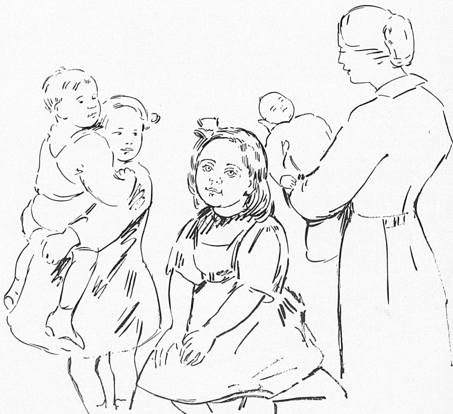
Zeichnungen, Dessins: Hanni Bay

Voici encore quelques chiffres éloquentes pour illustrer l'activité énorme déployée par l'Office central des œuvres sociales militaires et de ses succursales. Dans les huit premiers mois de l'année 1939, 5627 demandes de secours ont été enregistrées. Dans les six premières semaines après la mobilisation: 7314 demandes. Aujourd'hui, l'Office central verse par jour environ fr. 10,000.— de secours aux soldats et à leurs familles. En 1940, le Don national suisse et la Croix-Rouge organiseront de concert une collecte dans le peuple suisse, afin qu'ils puissent disposer des moyens financiers dont ils ont besoin pour accomplir leur tâche énorme. Par des versements grands et petits à cette collecte, chacun aura à cœur de contribuer à la grande œuvre en faveur des soldats et de leurs familles, pour qu'une fois de plus notre splendide devise nationale soit une magnifique réalité: Un pour tous, tous pour un!