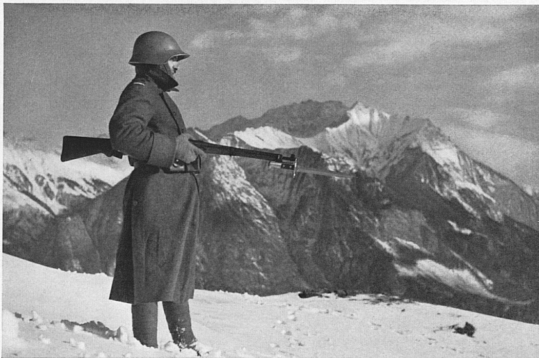
Wache im Gebirge — Faction dans la montagne (VI H 0212)