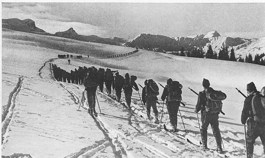
Auf dem Weg zur Passhhe — La monte (VI H 0211)

digen Elementen der Alpen verbinden. Voraussetzung ist allerdings eine gründliche Ausbildung des einzelnen Mannes zum Gebirgs-Winter-Soldaten. Wo hier noch Lücken klaffen sollten, werden sie binnen kurzer Zeit geschlossen werden. In grossem Mastab wird auf Befehl des Herrn Generals in der schweizerischen Armee Ski- und Winter-Gebirgsausbildung betrieben. Gebirgs- und Feldtruppen sind im Begriff, zahlreiche Offiziere, Unteroffiziere und Soldaten zu tchtigen Winterkmpfern auszubilden, die analog den finnischen Skitruppen fr wichtige und schwierige Aufgaben eingesetzt werden knnen. Wer unser winterliches Hochgebirge mit seinen Schneestrmen und Lawinen, pltzlichen Wetterstrzen und all den feindlichen Mchten kennt, mit denen der Mensch so hart wie gegen einen starken Feind kmpfen