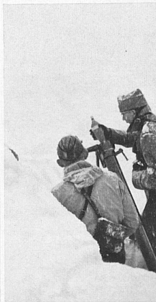
Links: Leichtes Maschinengewehr im Winter-Gebirgsdienst — A gauche: Le fusil-mitrailleur en montagne (VI H 0210)