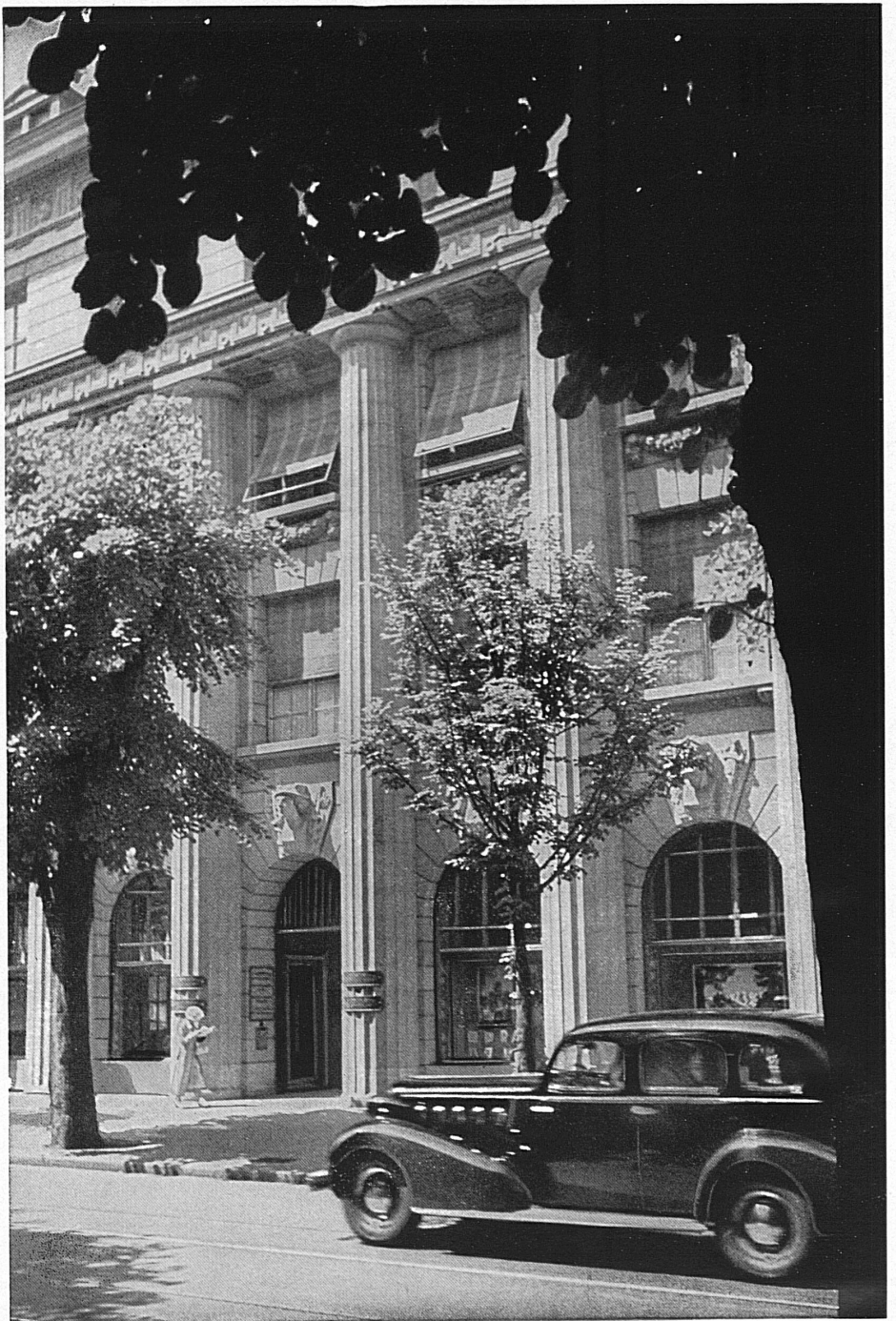
Eingang zum Bankgebäude in Zürich

Hoch überragte der touristische Fahnenmast mit seinen bunten Schildereien von Herbert Leupin die Abteilung der Schweizerischen Verkehrszentrale in der Halle III der Schweizer Mustermesse in Basel und bekundete den Durchhaltewillen des hart betroffenen schweizerischen Fremdenverkehrs. Möge im Laufe des Sommers auf manchem Schweizer Hotel in unsern Kurorten das weisse Kreuz im roten Feld fröhlich flattern, zum Zeichen, dass viele Tausende von Mitbürgern, die im Gastgewerbe tätig sind, dank der treuen Schweizer Kundschaft ihren Beruf auch heute ausüben können.