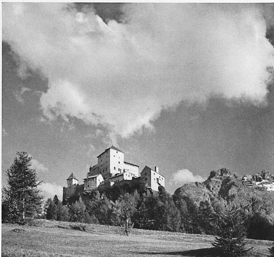
Le château de Tarasp au-dessus des Bains de Schuls-Tarasp-Vulpera Schloss Tarasp bei Bad Schuls-Tarasp-Vulpera