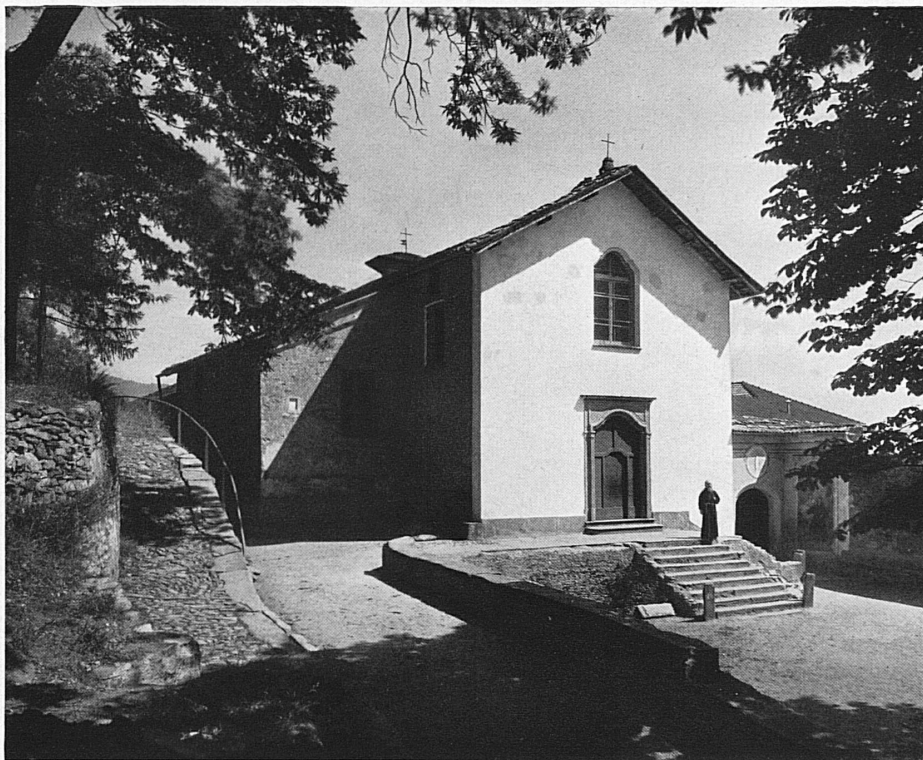
L'église du couvent Das Klosterkirchelein