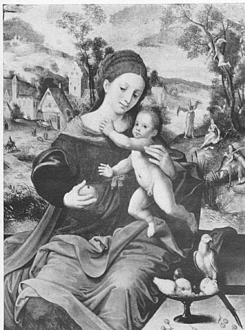
Une cellule de moine Eine Mönchszelle