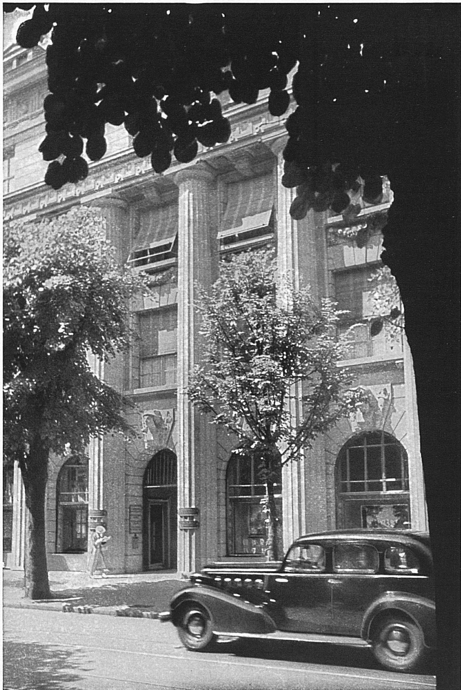
Eingang zum Bankgebäude in Zürich