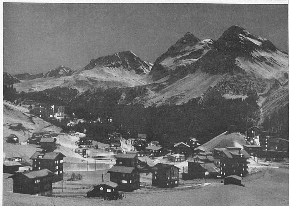
A gauche en haut: Crème fouettée sans coups. Dans la contrée de Grindelwald-Wengen (Oberland bernois). Le sommet du Lauberhorn, au-dessus de la petite Scheidegg, d'où s'envolent les skieurs. En bas: Sous le soleil de Flims. Dans le Bas-Valais: Verbier sous sa fourrure blanche. Page de droite: de haut en bas: La tribu des skieurs dans un des coins de son paradis: Le Hornberg sur Saanenmöser; ligne MOB. Au terminus du Villars-Bretaye. Kappelboden, près de Jaun, dans les Alpes fribourgeoises Nuit d'hiver à Arosa.