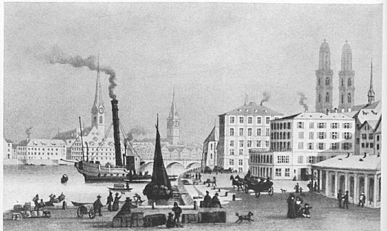
Dans les premiers temps de la navigation à vapeur sur les lacs de Thoun (gauche) et de Zurich. Aus der ersten Zeit des Dampfschiffverkehrs auf dem Thuner- und dem Zürichsee.