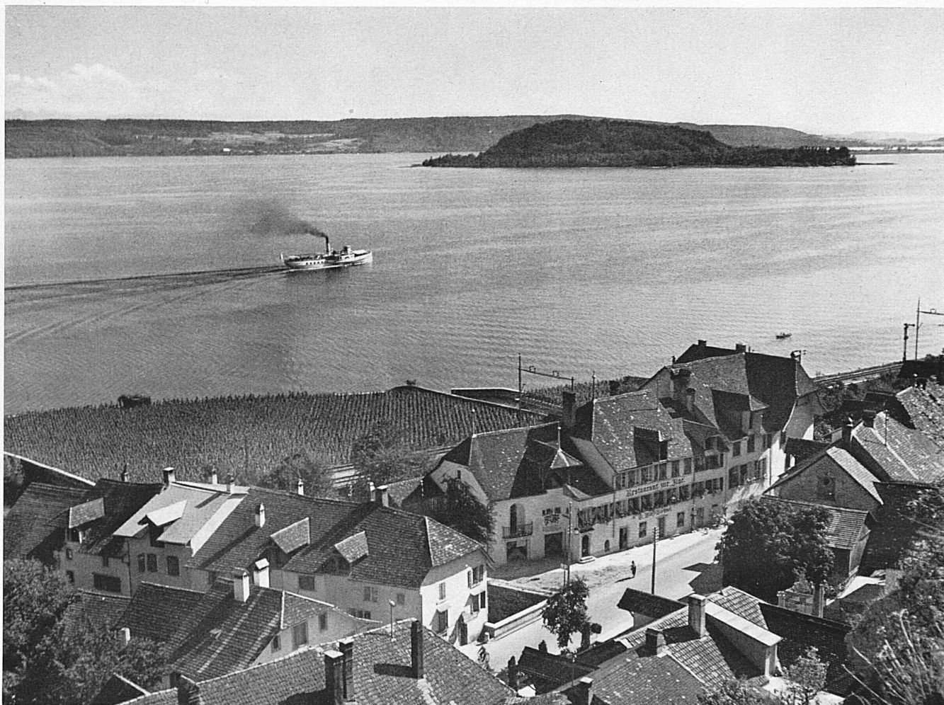
Douanne, le lac de Bienne et l'Île St-Pierre. Twann, der Bielersee und die Petersinsel.*