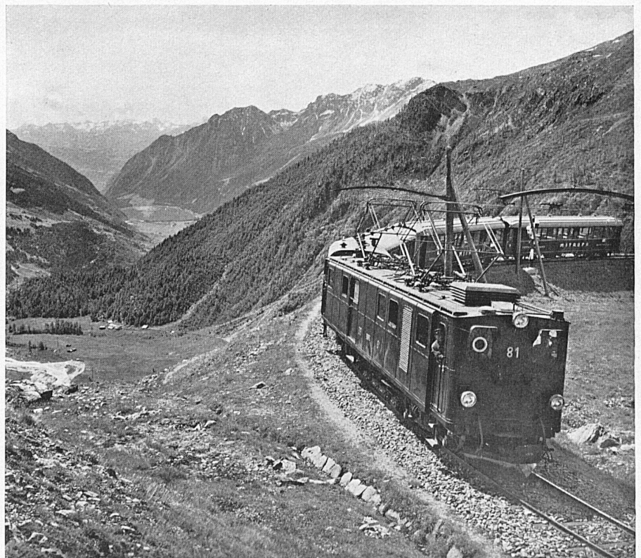
Die Berninabahn bei Alp Grüm. Blick in das Tal von Poschiavo.* Le chemin de fer de la Bernina près d'Alp Grüm. Vue sur la vallée de Poschiavo.

Dans les Grisons, pays de châteaux. Rhäzüns, colonie de vacances des Suisses à l'étranger.