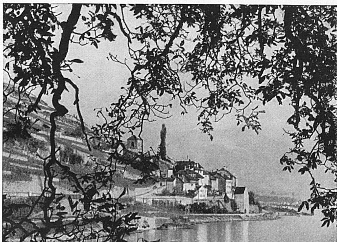
Das malerische St-Saphorin bei Vevey

11, Rue du Mont-Blanc Téléphones 2 64 20/29 Télégrammes: Louvialco